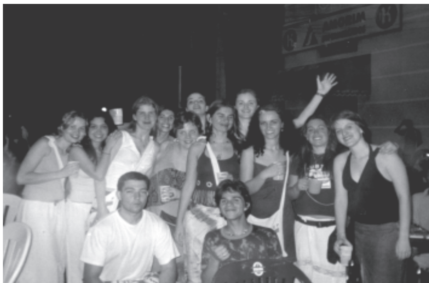
Uma parte dos gaúchos que foram ao ENEP 2003

Em Aracaju, no ano passado, um outro grupo marcou presença no 18o. ENEP: os gaúchos da UFRGS, PUC-RS e UNISC, que viraram lenda por terem viajado 60 horas de ônibus. Apesar disso tinham energia pra participar de todas as discussões, provocando